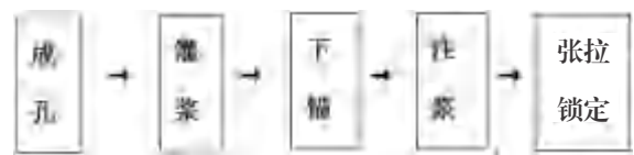
图 3 改进后锚索施工流程图

功率增压水泵，锚索钻机就位后校正孔位，调整角度，安装套管、钻杆开始钻孔，钻至锚索设计底标高后超钻 0.5 ~ 0.8m（沉淀段）停钻，停钻后内钻杆不拆卸，钻头保持压置于细颗粒土层上，利用内钻杆内壁注水转换接头连接注浆机，注入水灰比为 0.5 : 1 的纯水泥浆，注至孔口溢浆后保持继续注入 5 ~ 10min，确保返浆正常后停止注浆。钻孔过程中需提前将水泥浆搅拌好，钻孔完成后用清水反复清洗孔内泥皮及沉渣，确保钻孔孔内清洁，孔壁无污染物，注浆时压力不超过 0.5MPa，注浆完成后快速拆除双套管内钻杆，拆管时将制作完成的成品锚索抬至孔口，6 名钻工将锚索置于孔口垂直方向，拆管完成后将成品锚索沿套管内壁放入孔内，放置过程需连贯迅速，确保入索一次性完成。改进后锚索施工流程如图 3 所示。