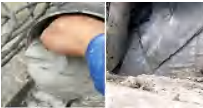
图 2 现场涌水涌砂照片

结合施工现场场地、地质条件及工期等因素综合考虑，无法通过修改锚索设计参数避开粉土等细颗粒地层，项目部采取调整锚索施工角度、调整施工孔深、更换锚索钻头钻具等措施分别进行试验，锚索成孔角度由原设计 25° 调整为 15°、30°，成孔深度由 33.5m 调整至 36m，根据调整进行相关成孔试验后均存在涌水、涌砂现象。现场涌水、涌砂照片如图 2 所示。